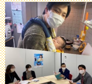
【男性社員の育児の様子と事業所内の様子】

2021年6月以降に子どもが生まれた男性社員に対し、1か月(20営業日)以上の育児休業取得を必須としている。現在、1名の男性社員が取得中。