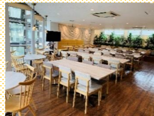
【BPOセンター長崎のリフレッシュルーム】

長崎市内の2センターともに従業員の女性比率は80%を超えており女性の採用比率がとても高い。管理者層(責任者クラス)の64%が女性であり、大いに活躍している。